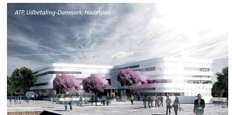
ATP, Udbetaling-Danmark, Haderslev.